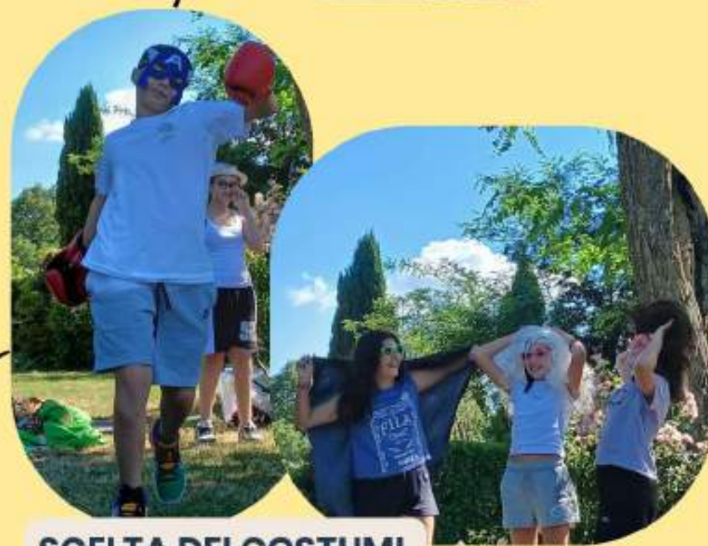
SCELTA DEI COSTUMI E OGGETTI DI SCENA