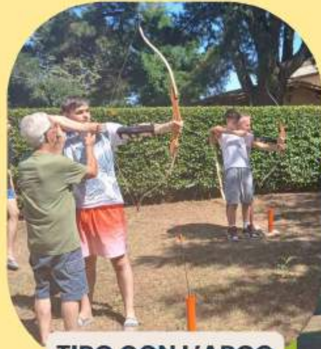
TIRO CON L'ARCO