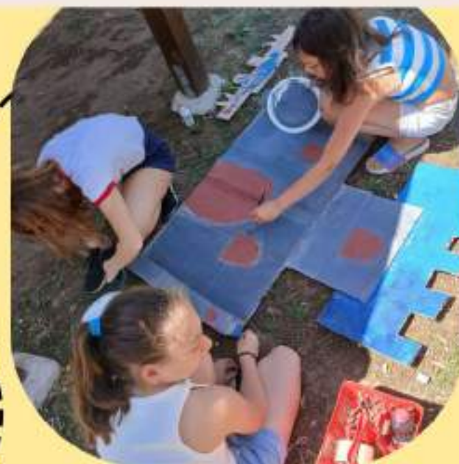
CREAZIONE DELLA SCENOGRAFIA