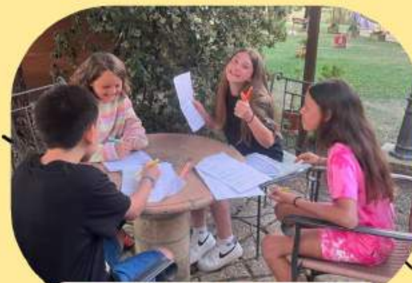
IMPARARE LE BATTUTE E PROVE GENERALI