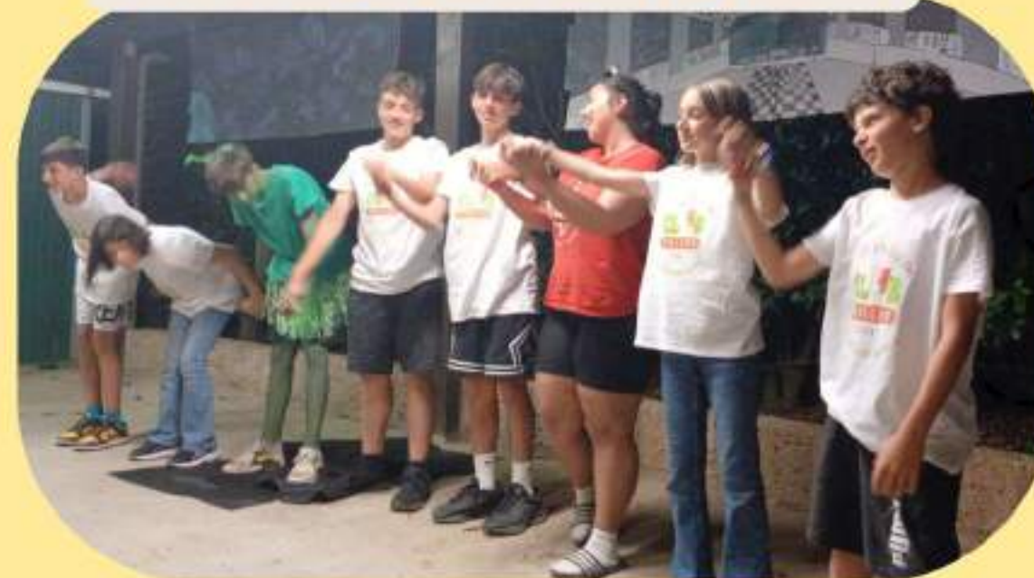
SI VA IN SCENA... BUONA LA PRIMA!