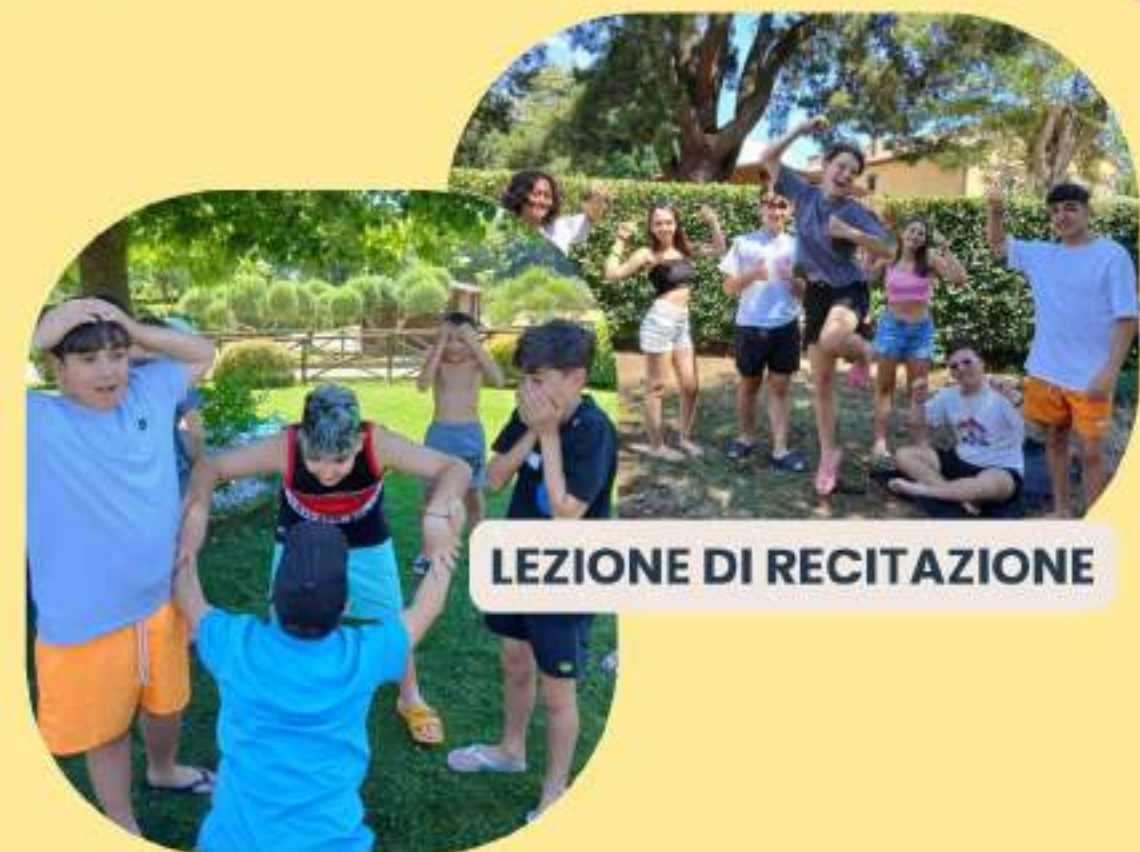
LEZIONE DI RECITAZIONE